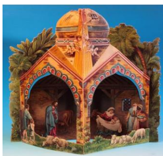
Un Presepe a Dalmine