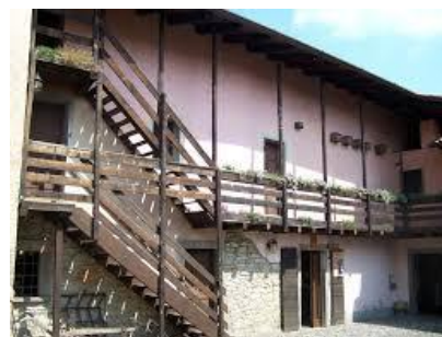
Sotto il Monte