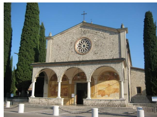
Santuario Madonna del Frassino

Ore 6.00 partenza dalla parrocchia di Poggio Grande, via autostrada per Peschiera del Garda nei cui pressi sorge il Santuario della Madonna del Frassino , uno dei monumenti di maggior spicco della zona. Le sue origini risalgono al 1510 quando fuori dalle mura di Peschiera del Garda apparve l'immagine della Vergine, su un vicino frassino che ora è conservato all'interno del santuario. Celebrazione della Santa Messa (ore 9.00) e breve tempo a disposizione per la visita. Proseguimento per Sirmione , una delle mete più frequentate del Lago di Garda in Lombardia. La piccola città si trova sulla punta di una stretta penisola della riva meridionale del lago.