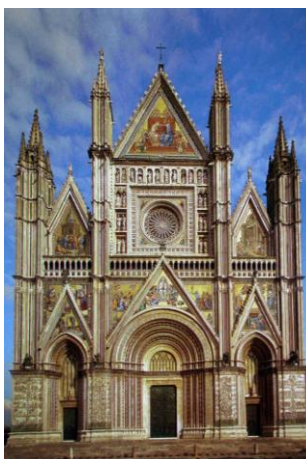
Il Duomo di Orvieto