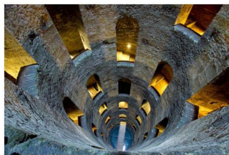
Il pozzo di S. Patrizio