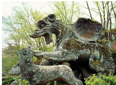
I mostri di Bomarzo

Al termine , passeggiata con la guida alla scoperta degli interessanti edifici medievali della città, le caratteristiche stradine e il Duomo al cui interno, tra i tanti capolavori è conservato uno splendido reliquiario gotico che contiene il Corporale del Miracolo di Bolsena. Pranzo in ristorante. Al pomeriggio, prima della partenza, visita al famoso pozzo di san Patrizio , un po' di tempo per lo shopping e viaggio di rientro .